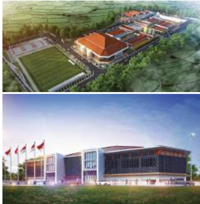
Gambar 3.5 Sketsa Kawasan Sport Center Klaten

Seperti ruang publik lain, sport center juga memiliki fungsi atau peran dalam kawasan sekitarnya. Fungsi yang timbul dari adanya sport center dari segi rekreasi, pendidikan, kesehatan, sosial, hingga bahkan perekonomian.