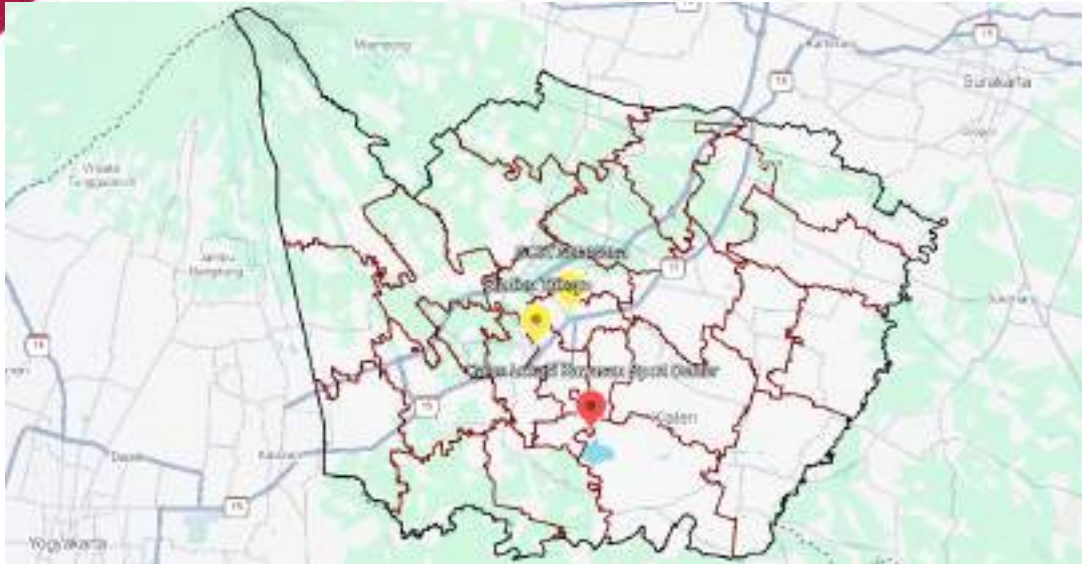
Gambar 3.4 Peta Calon Lokasi Kawasan Sport Center dan Persebaran Fasilitas Olahraga Eksisting yang Dikelola Pemda

Kawasan Sport Center yang direncanakan dibangun di Desa Krakitan, Bayat sebelah barat laut Waduk Rowo Jombor merupakan langkah untuk pemerataan fasilitas dan menjangkau lebih banyak lagi masyarakat untuk berolahraga. Kawasan ini akan semakin memacu pengembangan kawasan di poros selatan Kabupaten Klaten. Pembangunan sport center ini juga akan menampung lebih banyak lagi masyarakat dibandingkan kedua fasilitas olahraga eksisting. Dengan ragam fasilitas sport center yang akan tersedia dan daya tampung yang direncanakan lebih besar dari fasilitas eksisting akan memberikan banyak opsi bagi masyarakat. Dari segi aksesibilitas calon lokasi ini cukup dekat dengan Stasiun Kereta Api Klaten. Dengan jarak \pm 7 km dari Stasiun KA Klaten dapat ditempuh dengan mudah menggunakan kendaraan seperti motor dan mobil. Calon lokasi ini juga berjarak \pm 40 km dari pusat Kota Solo dan \pm 30 km dari pusat Kota Yogyakarta menjadikannya cukup strategis untuk mengadakan event-event olahraga dengan skala regional hingga nasional.